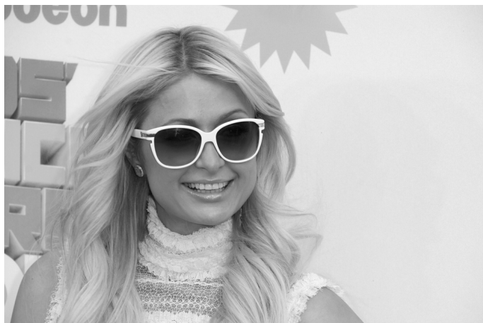
Paris Hilton, amerikanische Medienpersönlichkeit